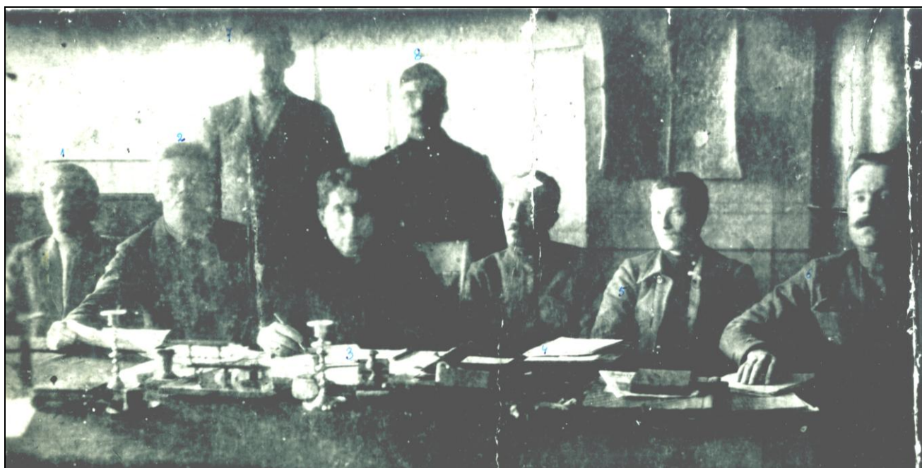
Подпись под фото: 1-е Правление Ижевских оружейных заводов после подавления восстания в ноябре 1918 г.

При приближении красных войск к Ижевску Чусоснабармом 14 был направлен в Ижевск для принятия военных заводов по длиннющему мандату за подписью Л. Красина, куда и прибыл 10 июня, т. е. на 3-й день по занятии н/войсками Ижевска. [с. 27]