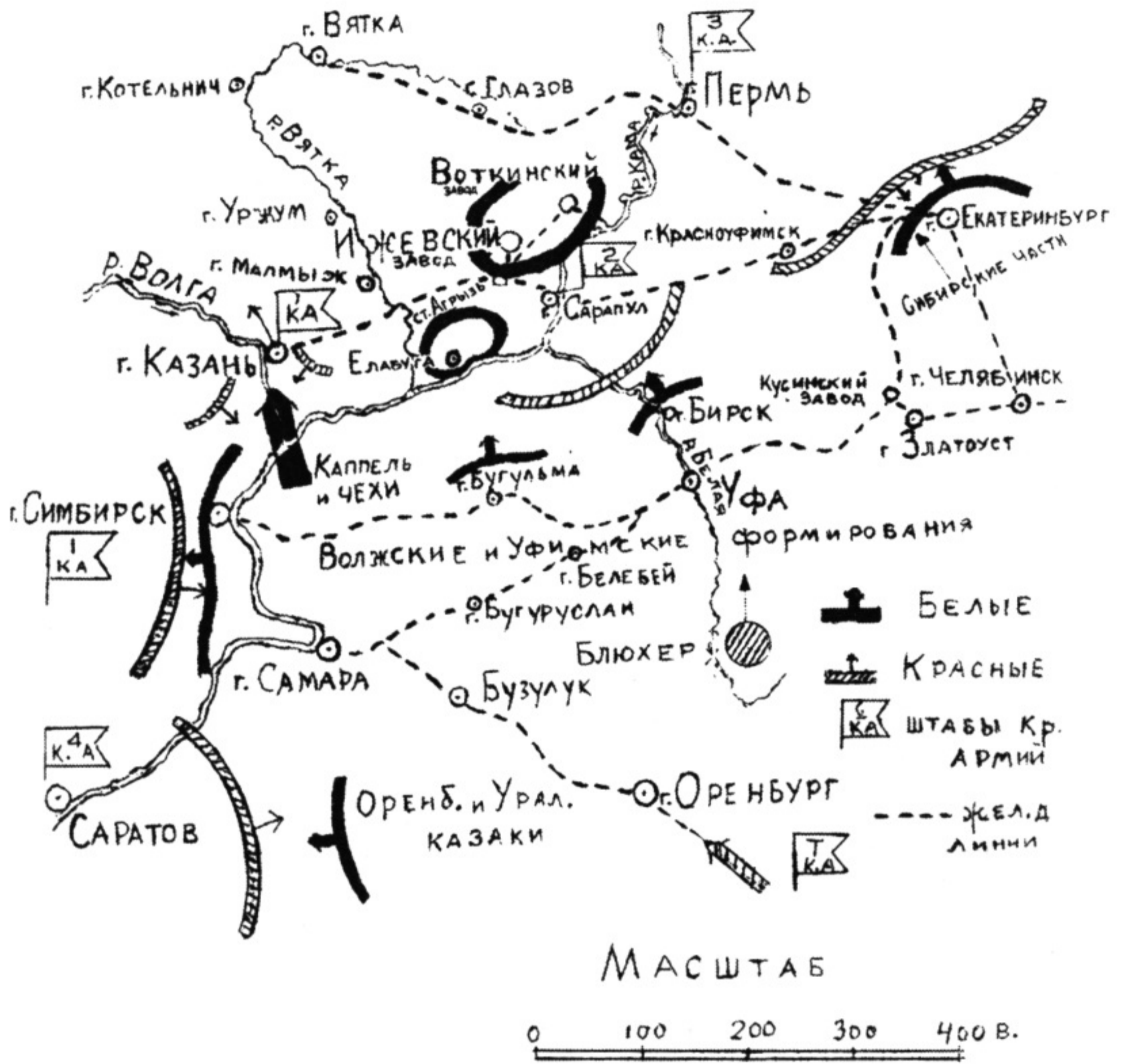
Схема № 1. Расположение противников на Восточном фронте к 7 августа 1918 г. (день восстания Ижевского завода)