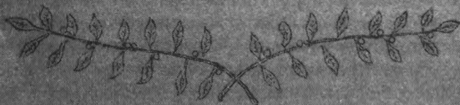
Обложка Памятки № 2