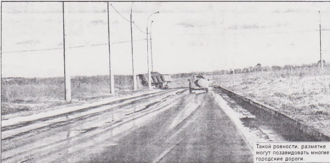
Такой ровности, разметке могут позавидовать многие городские дороги.

Ее построили «с нуля» за 110 миллионов рублей