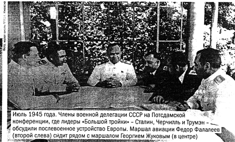
Июль 1945 года. Члены военной делегации СССР на Потсдамской конференции, где лидеры «Большой тройки» – Сталин, Черчилль и Трумэн – обсудили послевоенное устройство Европы. Маршал авиации Федор Фалалеев (второй слева) сидит рядом с маршалом Георгием Жуковым (в центре)

Взлетная полоса шла по будущей улице Молодежной