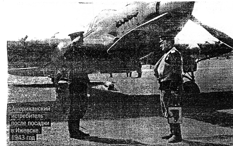
Американский истребитель после посадки в Ижевске. 1943 год