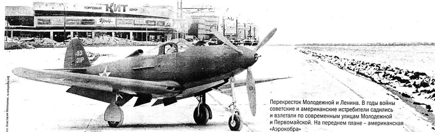
Перекресток Молодежной и Ленина. В годы войны советские и американские истребители садились и взлетали по современным улицам Молодежной и Первомайской. На переднем плане – американская «Аэрокобра»

В годы войны по нынешним улицам Первомайской и Молодежной проходила взлетно-посадочная полоса