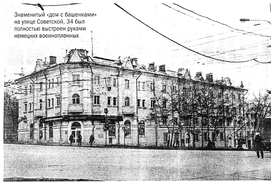
Знаменитый «дом с башенками» на улице Советской, 34 был полностью выстроен руками немецких военнопленных