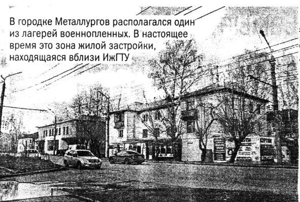
В городке Metallurgov располагался один из лагерей военнопленных. В настоящее время это зона жилой застройки, находящаяся вблизи ИЖГТУ

20-27 октября В Удмуртии провели «недельник помощи госпиталиям», в рамках которого был полностью закончен ремонт зданий эвакуогоспиталей, заготовлены овощи для питания раненых, выполнен план по заготовке топлива – 676 тыс. кубометров дров.