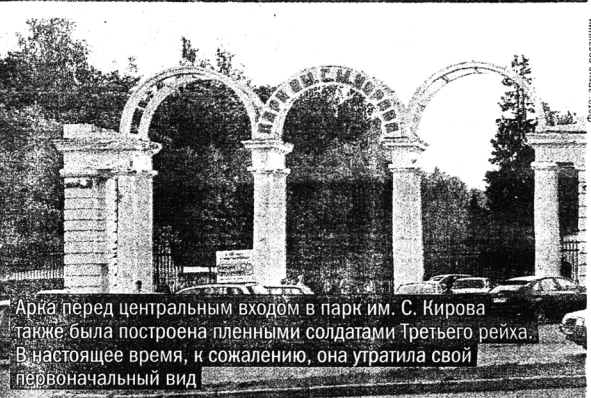
Арка перед центральным входом в парк им. С. Кирова также была построена пленными солдатами Третьего рейха. В настоящее время, к сожалению, она утратила свой первоначальный вид