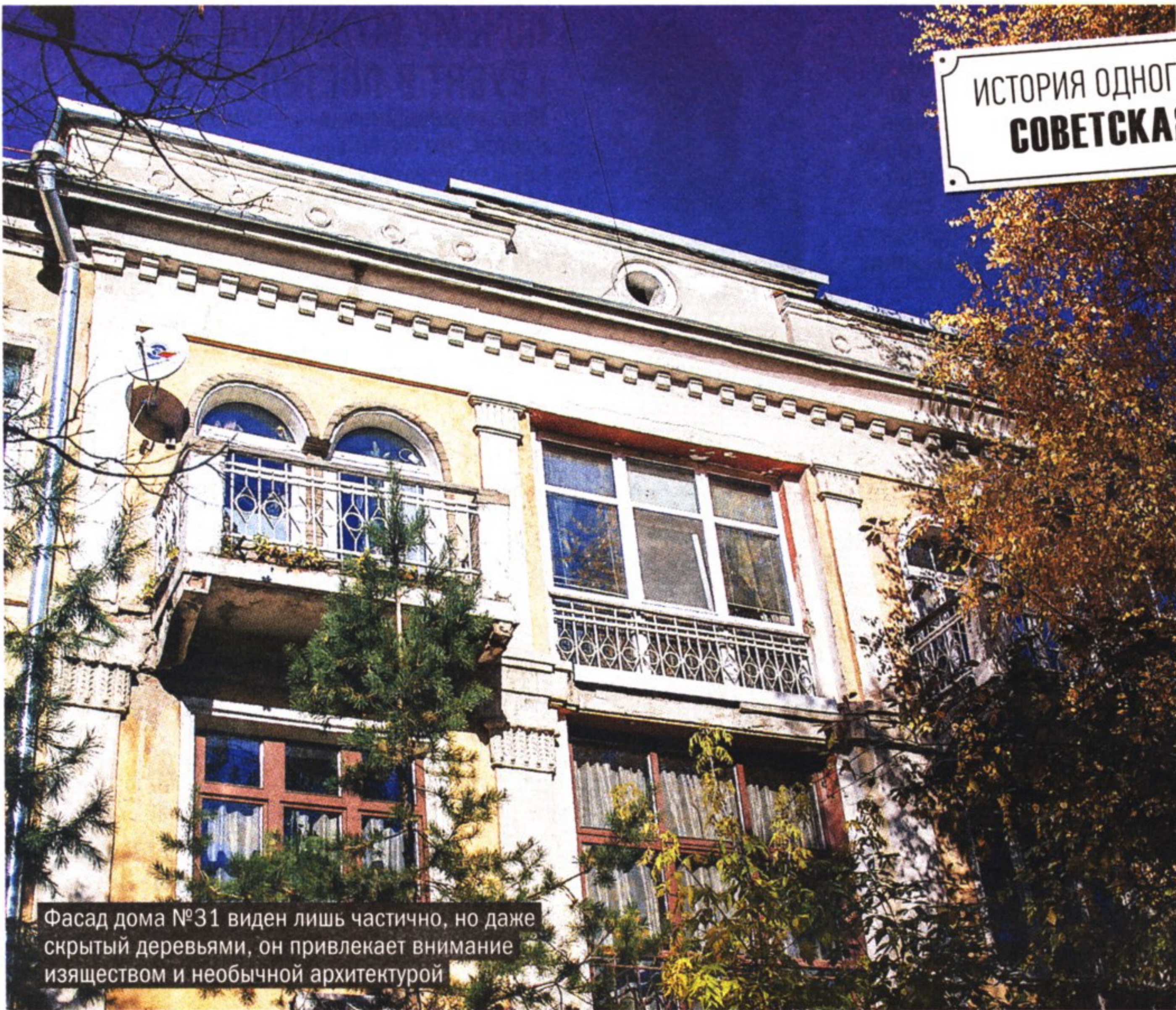
Фасад дома №31 виден лишь частично, но даже скрытый деревьями, он привлекает внимание изяществом и необычной архитектурой