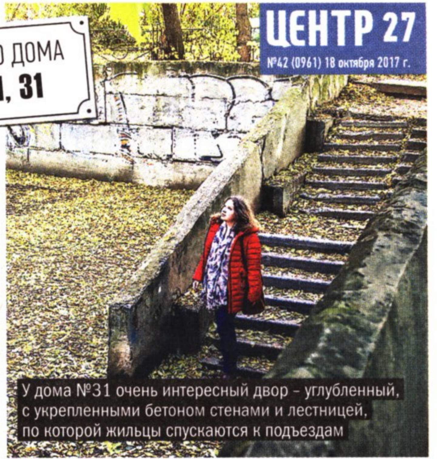
У дома №31 очень интересный двор – углубленный, с укрепленными бетоном стенами и лестницей, по которой жильцы спускаются к подъездам