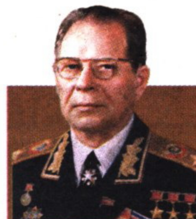
Дмитрий Федорович Устинов (1908-1984) . Во время Великой Отечественной войны — нарком вооружения СССР, после этого был министром вооружения, министром оборонной промышленности, министром обороны. Занимал высокие посты в партийном руководстве страны. Маршал СССР, дважды Герой Соцтруда.