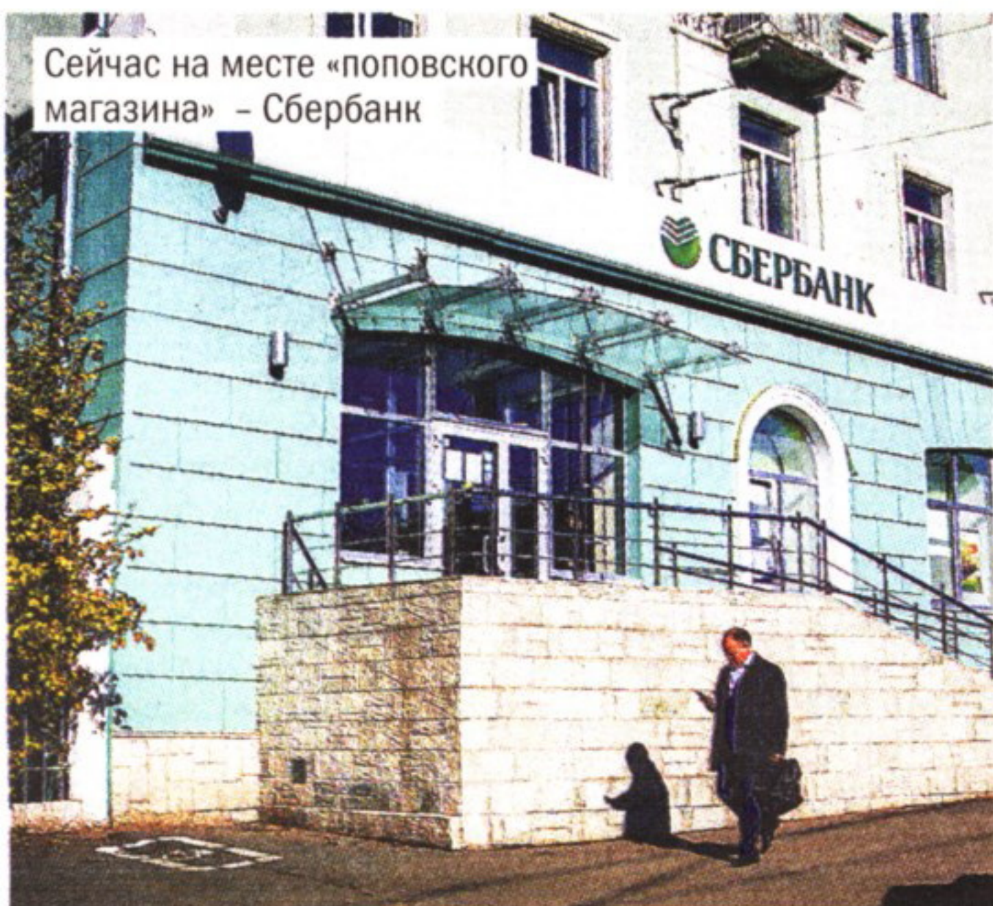
Сейчас на месте «поповского магазина» – Сбербанк

К слову, магазин, как и весь дом №231, называли «поповским» якобы из-за того, что когда-то тут стоял дом местного священника, настоятеля Троицкого храма.