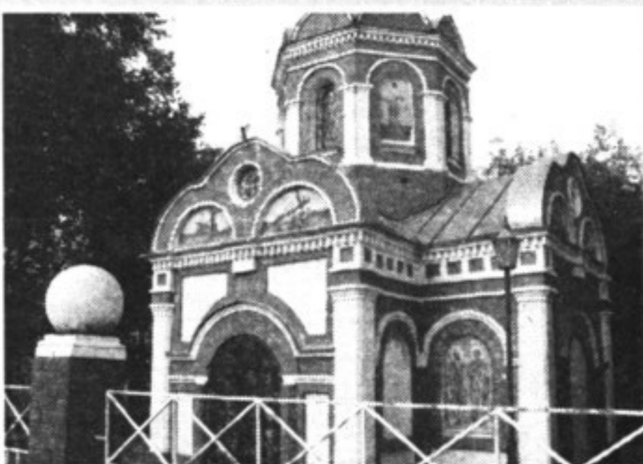
Крестовоздвиженская часовня построена в 1879 году (по другим данным – в 1885 году) по проекту архитектора Н.И. Коковихина. Является памятником истории и культуры республиканского значения.