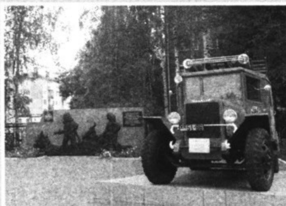
В 2015 году на территории пожарной части установили мемориал пожарным-спасателям в честь 25-летия МЧС России «во славу героизма и мужества тех, чья работа – подвиг, а главная награда – спасенная человеческая жизнь».