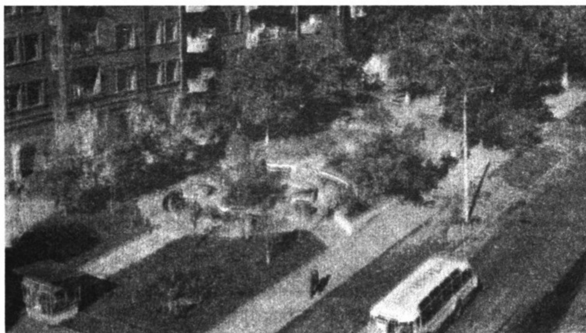
На архивной фотографии видно, что когда-то по ул. Коммунаров курсировал автобус