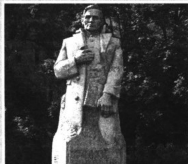
Памятник одному из основоположников удмуртской государственности - Троикаю Борисову - врачу по профессии, ученому-филологу, этнографу, публицисту, общественному деятелю.