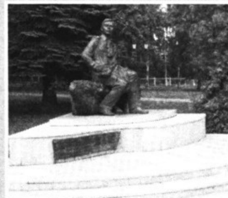
Памятник Кузебаю Герду - широко известному в 20-х годах талантливому поэту и прозаику, фольклористу, драматургу и музыковеду, переводчику и общественному деятелю.