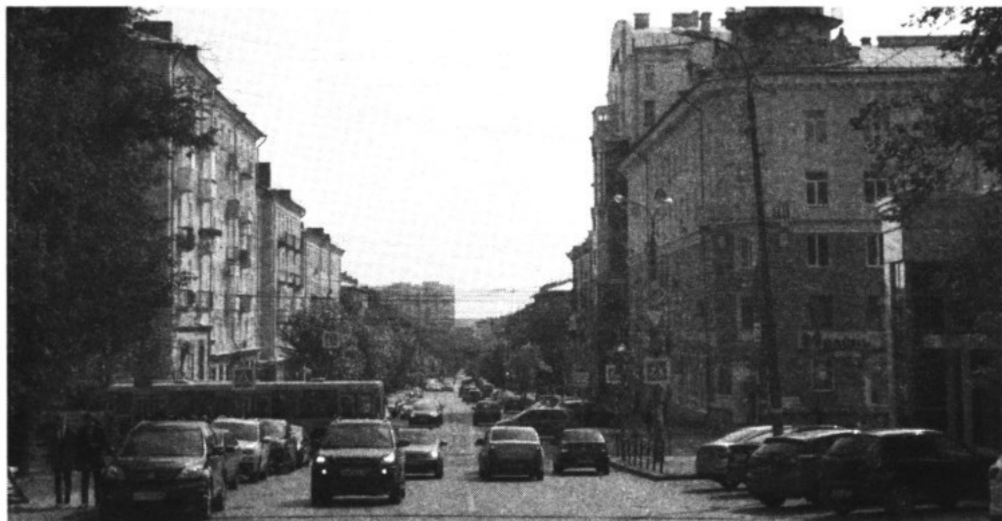
Современная улица Коммунаров

наров. Здесь ещё сохранился совсем другой уклад жизни - в две шеренги стоят деревянные домики, «говорящие» о старом Ижевске. Дальше улица прерывается и продолжается только через квартал, на перекрёстке с улицей Карла Либкнехта. Здесь находится школа № 48, которую знает каждый ижевчанин благодаря панно на торце здания, прославляющему советские «стройки века» - КамАЗ, БАМ, ГЭС.