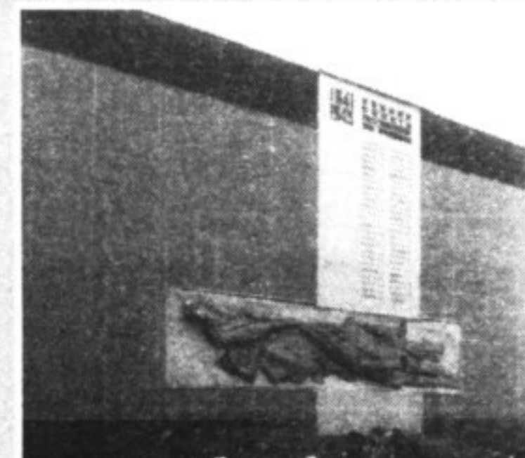
Во дворе медакадемии находится стена преподавателям и выпускникам, погибшим в годы Великой Отечественной войны