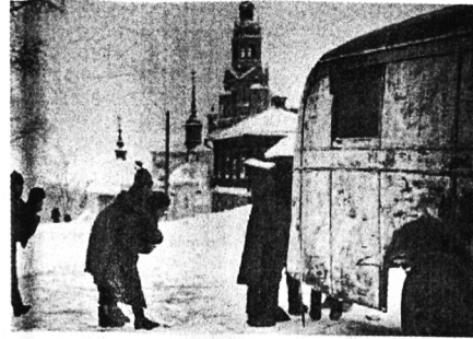
Погрузка раненого, 1941 г.

ВСЮ ВОЙНУ, КАЖДУЮ НЕДЕЛЮ, В САРАНУЛ ШЛИ САНИТАРНЫЕ ПОЕЗДА