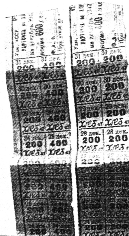
По таким талонам во время войны выдавали хлеб - по 600 граммов в день для рабочих и 400 - для служащих.