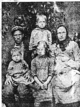
Единственная фотография с отцом.

АИФ НЕЛЬЗЯ БЫТЬ ИВАНОМ, НЕ ПОМНЯЩИМ РОДСТВА