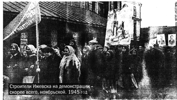
Строители Ижевска на демонстрации – скорее всего, ноябрьской. 1945 год

Пусть эта фотография сделана уже после войны, с ее помощью, тем не менее, можно представить, как работали ижевские строители 70 лет назад