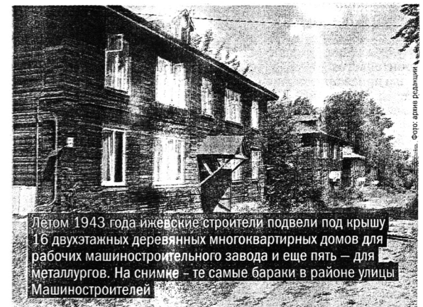
Летом 1943 года ижевские строители подвели под крышу 16 двухэтажных деревянных многоквартирных домов для рабочих машиностроительного завода и еще пять – для металлургов. На снимке – те самые бараки в районе улицы Машиностроителей