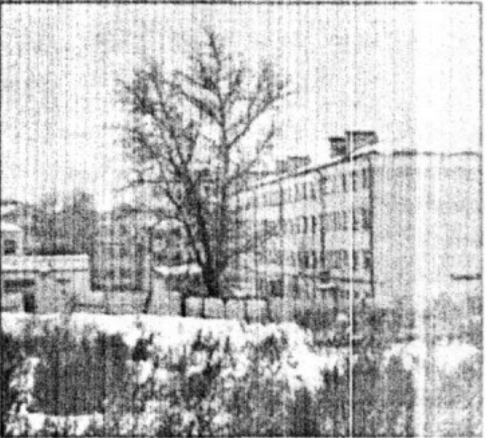
Дома № 210 уже нет.