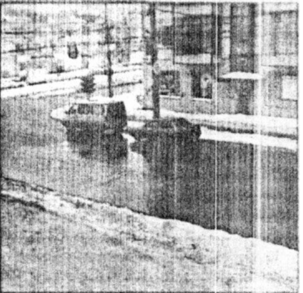
Тот же дом в наше время.