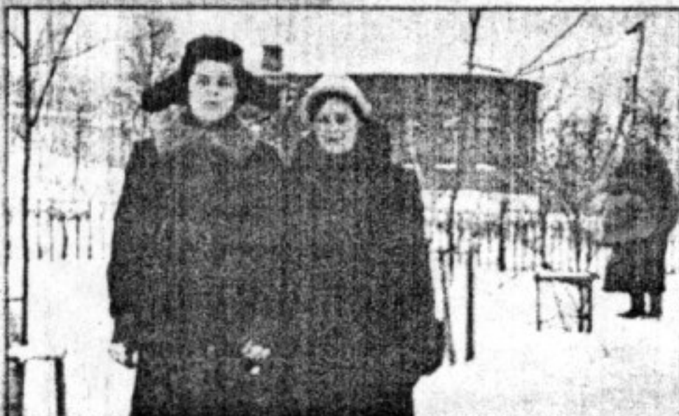
На месте Свято-Михайловского собора высадили саженцы клена. На заднем плане - «водокачка».