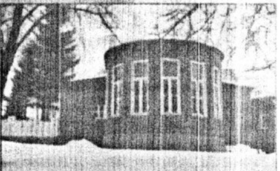
Тот же самая «водокачка», вид с другой стороны.