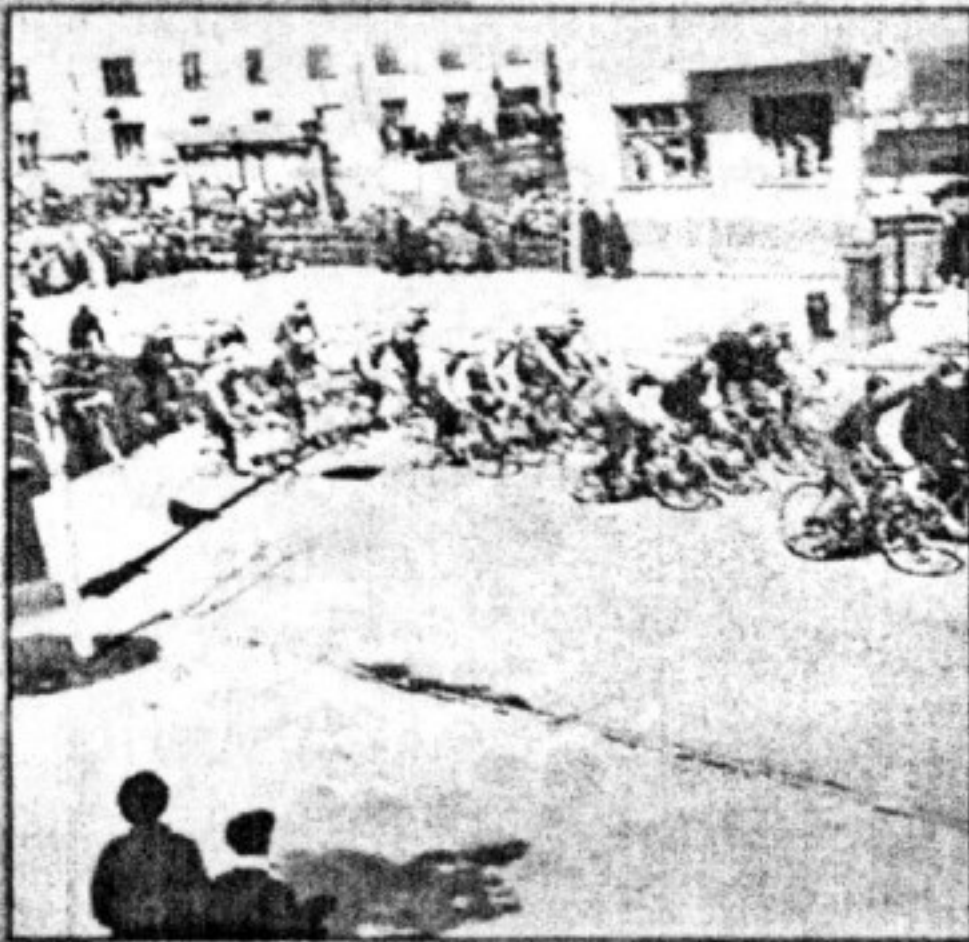
Ул. Советская, дом № 208.