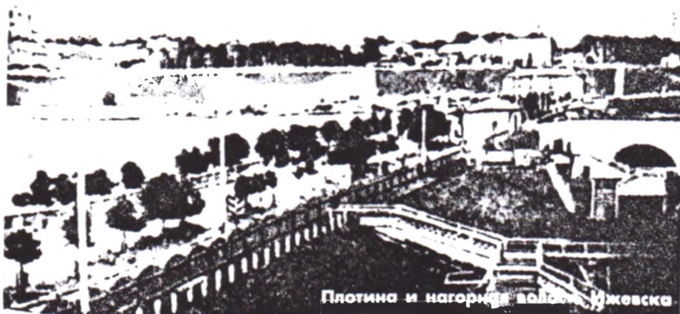
Плотина и нагорная волость Ижевска