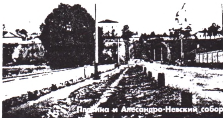
Плотина и Александро-Невский собор

Несладким было житье в Зареке. Это вам не привилегированная Гора, где обитали инженеры, офицеры, священники, купцы да самые высококлассные мастера, многие из которых удостоены были царского кафтана. Зареченские обитатели – голь заводская, зачастую ни самовара, ни часов не имевшая. Пробьет на заводской башне колокол в четыре утра – значит, на завод пора. Да и климат здешний оставлял желать лучшего: низина да болотина, несмотря на отводные канавы. Нет, невысоко котиновалась ижевская Заречка в то время, что и отметил священник В. Успенский: «...Жители Заречной части завода много беднее нагорных. Некоторые из них, достигши некоторого