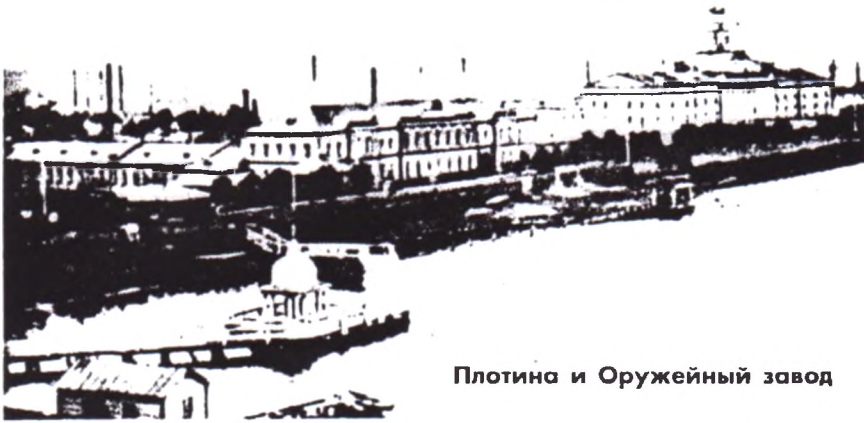
Плотина и Оружейный завод