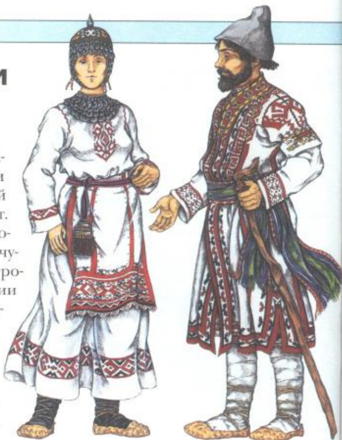
Чувашский мужской и женский праздничный костюм

Это событие всегда отмечается празднично и торжественно. Хозяйки выпекали пышные колоба, варили яйца, пекли блины, заготавливали вербу. Все это в совокупности — символы плодородия и благополучия. В день выгона скота молились в сторону востока.