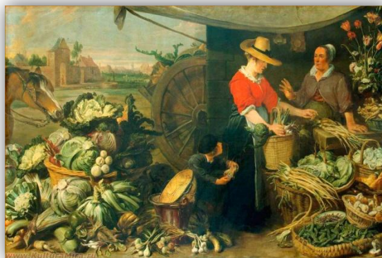
Овощная лавка. Ф. Снайдерс, 1618 г.

БИБЛИОТЕКАРЬ: Вот какой овощ даёт нам октябрь. Одна из прелестей капусты в том, что её различные сорта доступны круглый год!