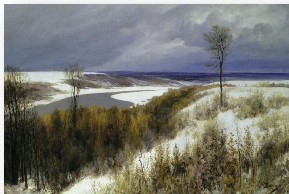
В.Д. Поленов Ранний снег