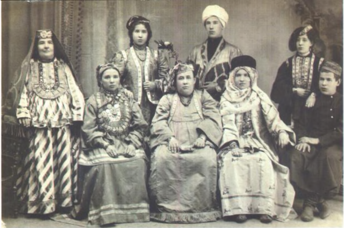
Семья богатого Казанского купца в костюмах XIX – начала XX вв. Фото. г.Казань, 1910 г.

Казанның бай сәүдәгәре гаиләсе XIX йөз – XX йөз башы костюмдарында. Фото. Казан шәһәре. 1910 ел.