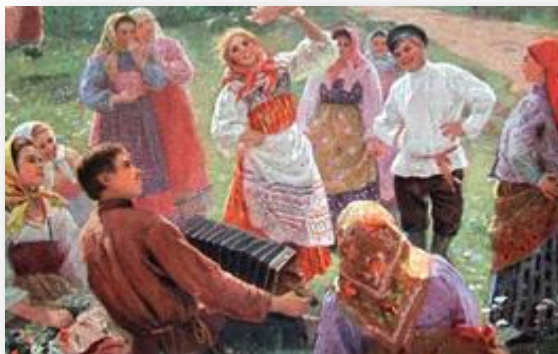
Ф.В. Сычков Пляска

Красная горка на Руси составляет первый весенний праздник. Великоруссы здесь встречают весну, венчают суженых, разыгрывают хороводы. Малоруссы отправляют свои веснянки, ходят с песнями по улицам.