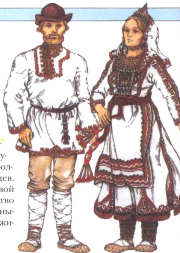
МариЙский мужской и женский праздничный костюм

в другое место. Вокруг родника не рубят деревья и в воду ничего не бросают — она священна. А если мариЙцу нужно срубить дерево, то он обращается к духу этого дерева, объясняя, с какой целью это делается, и просит простить этот грех.