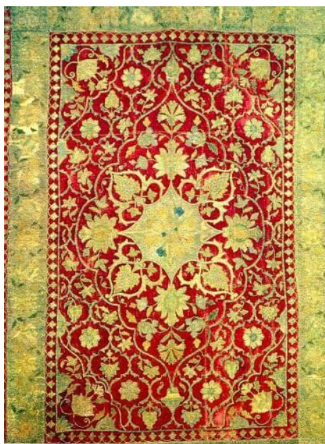
Вышивка для интерьера

Золотое шитье - наиболее древнее из всех видов вышивок. Для основы использовали очень плотные ткани. Лучшим материалом служил однотонный бархат красного, бордового, фиолетового и зеленого цветов. Вышивали также на тонком сукне различных тонов, парче, тирьме, атласе и сафьяновой коже. Для золотого шитья использовали золотые или серебряные нити фабричной выработки. Этот род вышивки назывался одним термином — гюля-батын. Чаще всего золотым шитьем украшали верхнюю женскую одежду, головные уборы, предметы домашнего быта, конные украшения и более мелкие изделия. Существовал даже обычай включать в приданое невесты различные предметы бытового назначения, вышитые золотом.