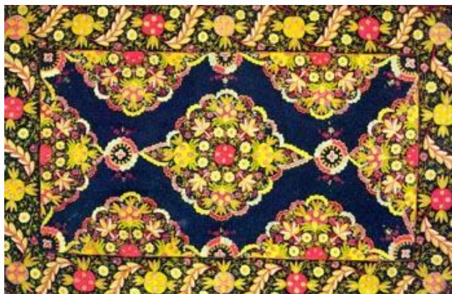
Чехол на большую подушку

Много интересных фактов развития ремесел в Азербайджане сообщают многочисленные купцы, путешественники и дипломаты, побывавшие здесь в различное время. Так, итальянский путешественник Марко Поло (XIII век) отмечал красоту шелковых изделий в Шемахе и Барде. Английский путешественник-купец Антоний Дженкинсон (XVI век), описывая роскошь летней резиденции, пишет, что «король сидел в богатом шатре, сшитом шелками и золотом», одежда его была расшита жемчугом и драгоценными камнями.