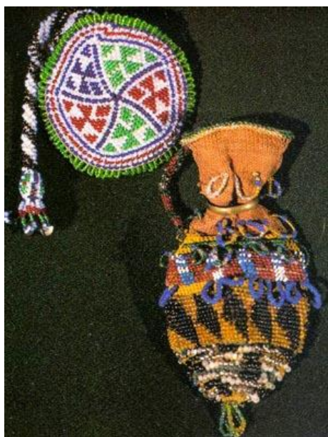
Футляр для часов. Вышивка бисером

Вышивки жемчугом и бисером издавна украшали элементы костюма, предметы быта и так далее.