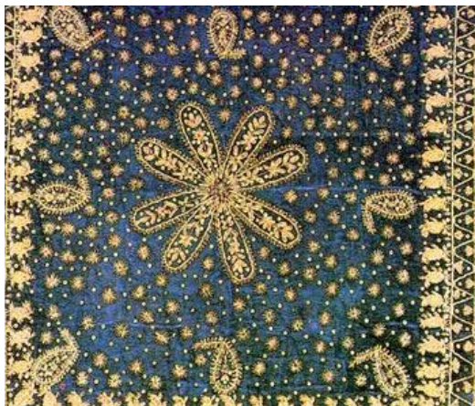
Ортык. Покрывало на столик

Для этой вышивки обычно использовали шелковые и шерстяные цветные нитки неярких, пастельных тонов, часто в сочетании с золотыми. Имелось два вида вышивок гладью: двухсторонняя и односторонняя гладь. Гладью вышивали одежду, настенные украшения, покрывала для лица, занавеси и так далее.